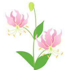
グロリオサの花言葉:「勇敢」「栄光」

5月11日から高校総体が開催される予定です。連休中には対外試合等を予定している部活動もあると思いますが、各教科・科目から課題も出されると思いますので、計画的に家庭学習にも取り組みましょう。