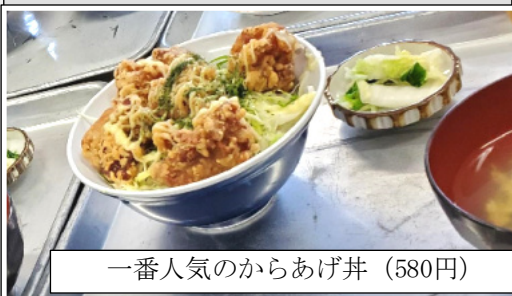
一番人気のからあげ丼 (580円)

他にも、つけ麺やタンタンメンなど、麺類が多く票を集めました！都留高の学食といえばからあげ丼、ですが、ラーメンやタンタンメンなどもぜひ食べてみてください。ちなみに、からあげ丼は予約しないとなくなってしまうこともあります。1