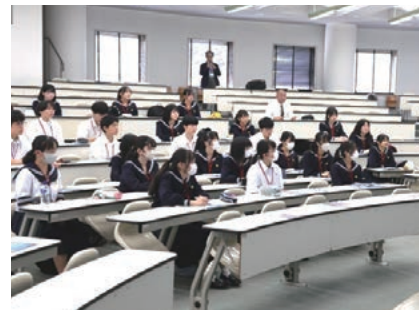
東京都立大学訪問